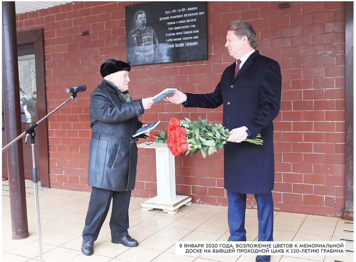
9 ЯНВАРЯ 2020 ГОДА. ВОЗЛОЖЕНИЕ ЦВЕТОВ К МЕМОРИАЛЬНОЙ ДОСКЕ НА БЫВШЕЙ ПРОХОДНОЙ ЦАКБ К 120-ЛЕТИЮ ГРАБИНА

Во время приёма я выразил обеспокоенность, что память о конструкторе артиллерийских систем не увековечена в городе в виде памятника, и предложил установить его на территории городского Мемориала Славы. Хочу отметить, что начиная с 2000 года я совместно с ветеранами РКК «Энергия» неоднократно обращался к администрации города с обоснованием установки памятника. Всё это рассматривалось, но никакой реакции не было. Обращался от имени ветеранов много лет к руководству города, но, к сожалению, безрезультатно. Но в этот раз всё было по-другому. На той встрече я подарил Главе города свою книгу «Гений артиллерии» и предложил использовать её для патриотического воспитания молодого поколения. Он поддержал идею установки памятника, сказав: «Памятнику быть!» О нашей встрече было напечатано в газете на первой полосе. После началось взаимодействие по вопросу разработки будущего памятника и выбору места