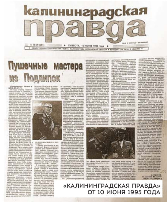
«КАЛИНИНГРАДСКАЯ ПРАВДА» ОТ 10 ИЮНЯ 1995 ГОДА